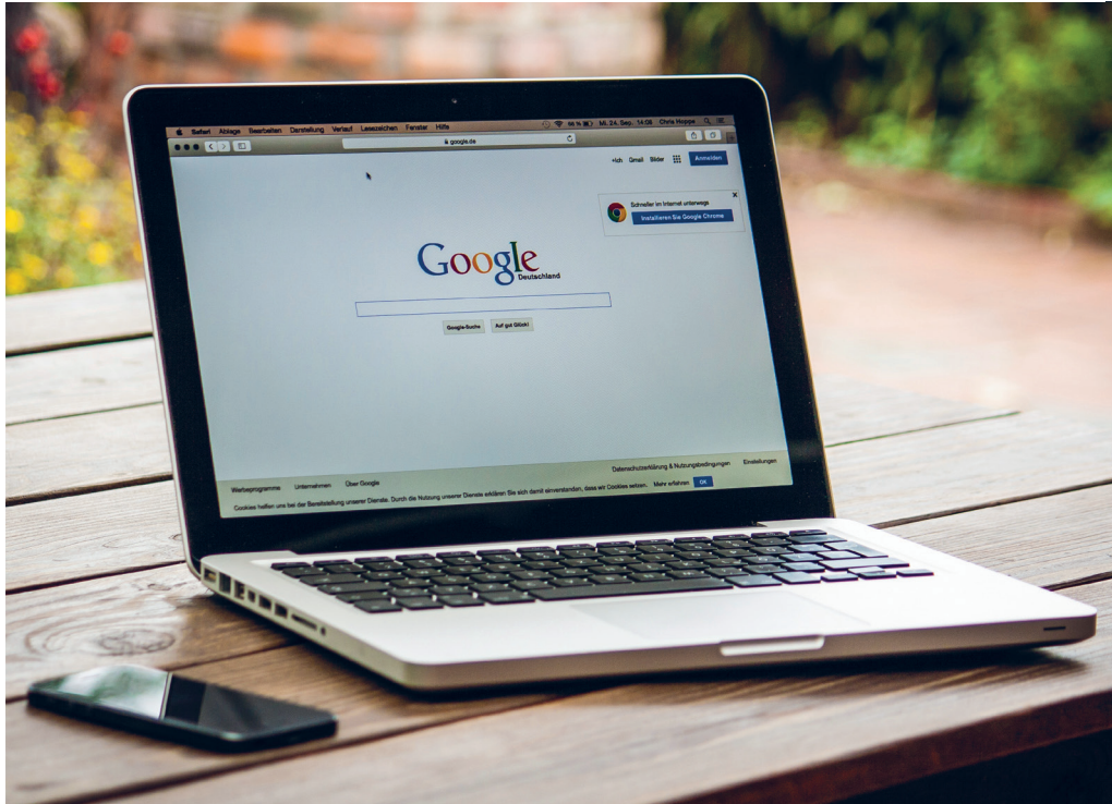
Computador n° 1/ Portátil / 8G Memoria RAM